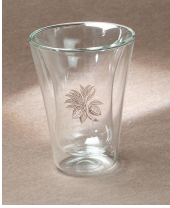
WR34 Verre Xocolatl, 1.8 dl, double paroi