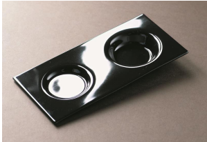
WR35 Plateaux verre Xocolatl, noir