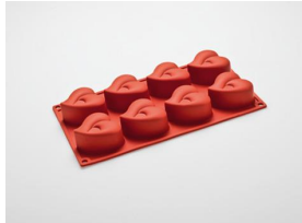
VO39 Moule en silicone coeur pour 8 pièce