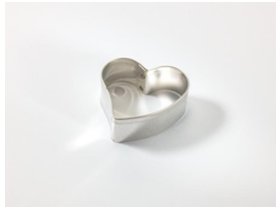
WG07 Emporte-pièce, forme de coeur