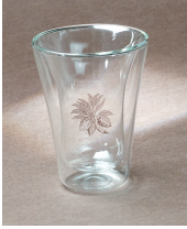
WR34 Glas Xocolatl, 1.8 dl, doppelwandig