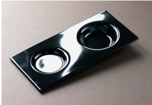
WR35 Glas-Tablett Xocolatl, schwarz

260 x 125 x 20 mm Mindestbestellmenge 6 Stück