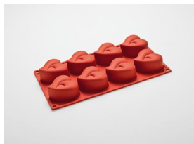
VO39 Silikon-Backform Herz für 8 Stück