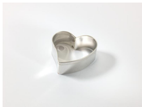
WG07 Ausstecher Herzform