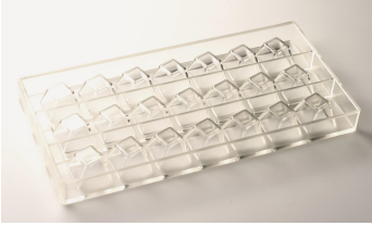
VO32 Moule praliné Tango 10g