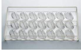
VM04 Moule bonbon chocolat Mythen 10g